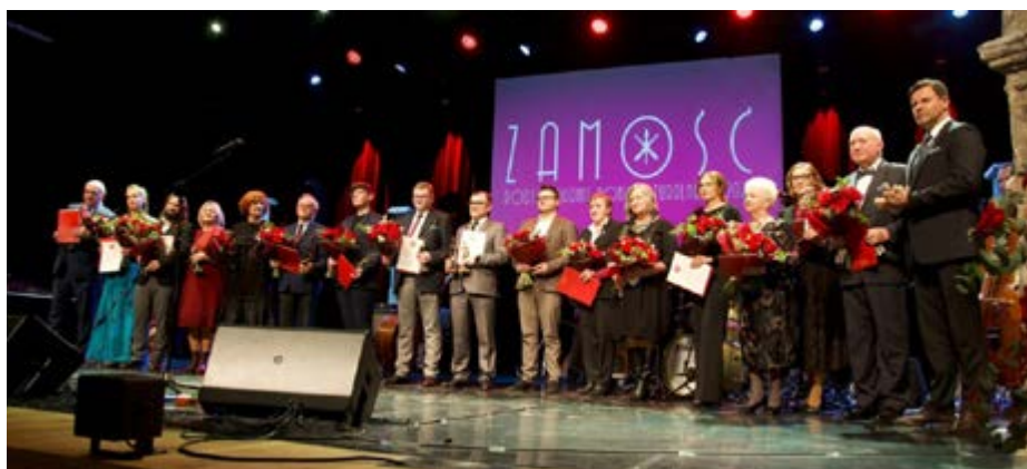
Laureaci Gali Kultury w Zamościu.