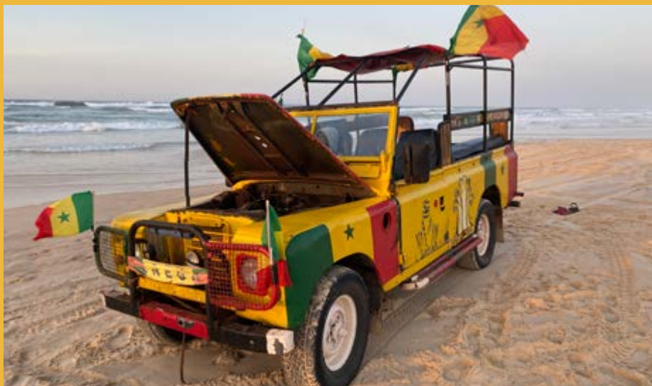
Tym samochodem dojechaliśmy na brzeg Jeziora Różowego – mety Rajdu Paryż–Dakar