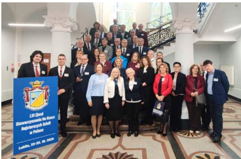
Pamiątkowe zdjęcie uczestników zjazdu

Katolicki Uniwersytet Lubelski Jana Pawła II czy Uniwersytet Przyrodniczy. W spotkaniu uczestniczyli także przedstawiciele Rady Rodziców ZSE oraz przedstawiciele nauczycieli i uczniów.