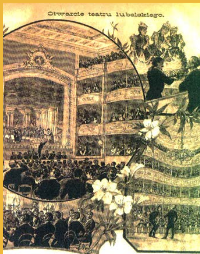
Plakat zapowiadający otwarcie teatru w Lublinie. W br. teatr (obecnie im. Juliusza Osterwy) obchodzi 140-lecie swego istnienia, o czym szerzej piszemy na str. 14-15