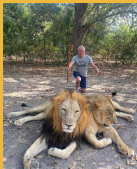
Pamiątkowe zdjęcie autora z miejscową zwierzyną