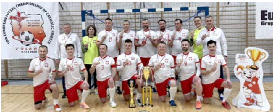
Mistrzowie Europy Księży w piłce nożnej