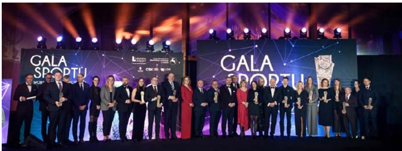
Sportowa Rodzina Lubelszczyzny, foto UMWL