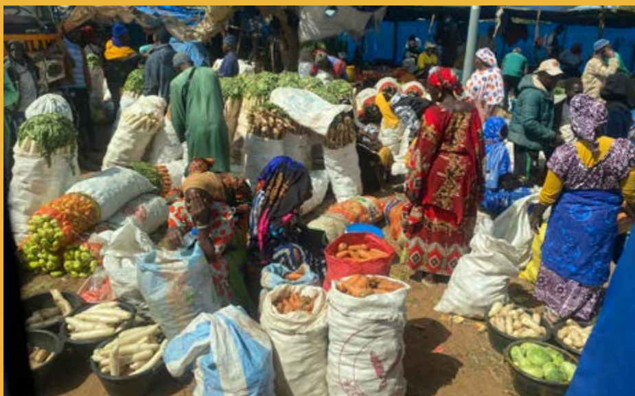
Bardzo kolorowe, typowo afrykańskie targowisko tuż obok przejścia granicznego między Gambią a Senegalem