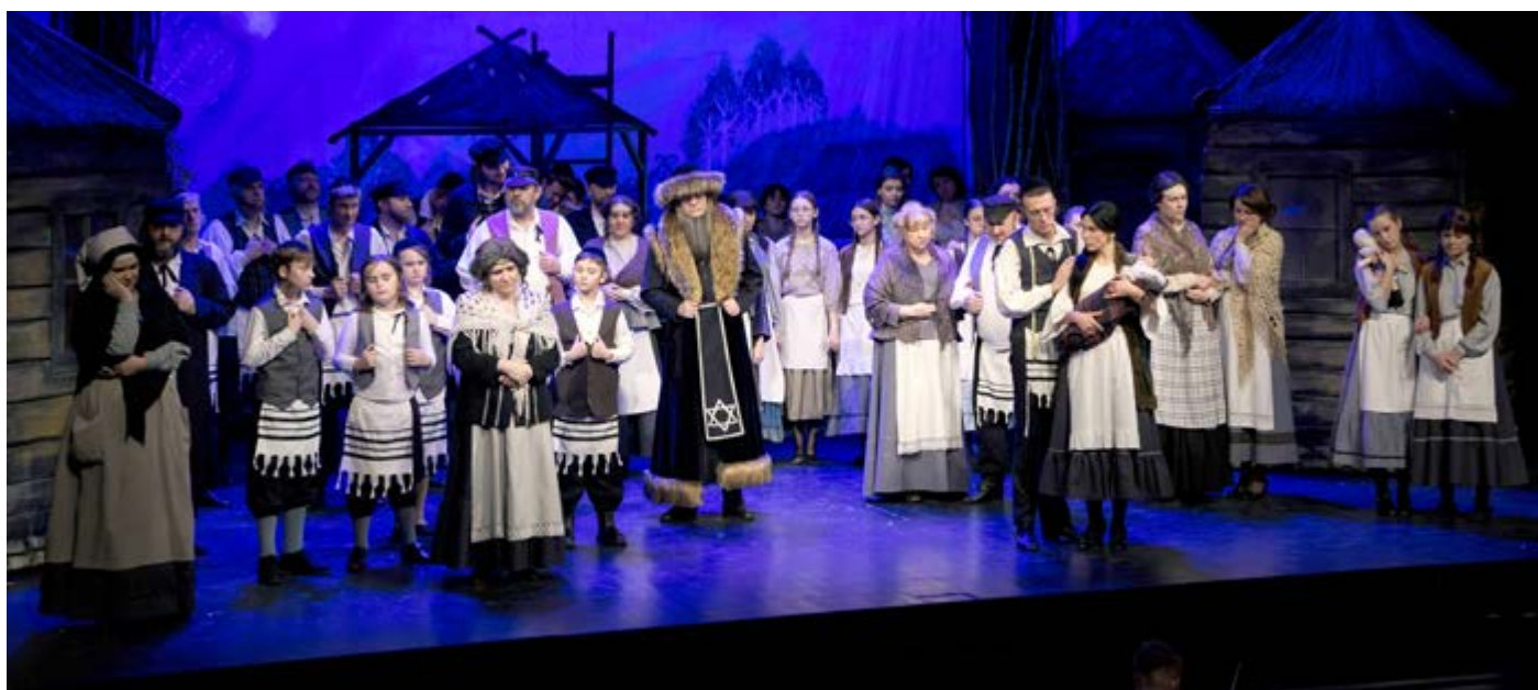
Musical „Skrzypek na dachu” grany jest w Lublinie od wielu lat, ale chętnych na jego obejrzenie wciąż nie brakuje