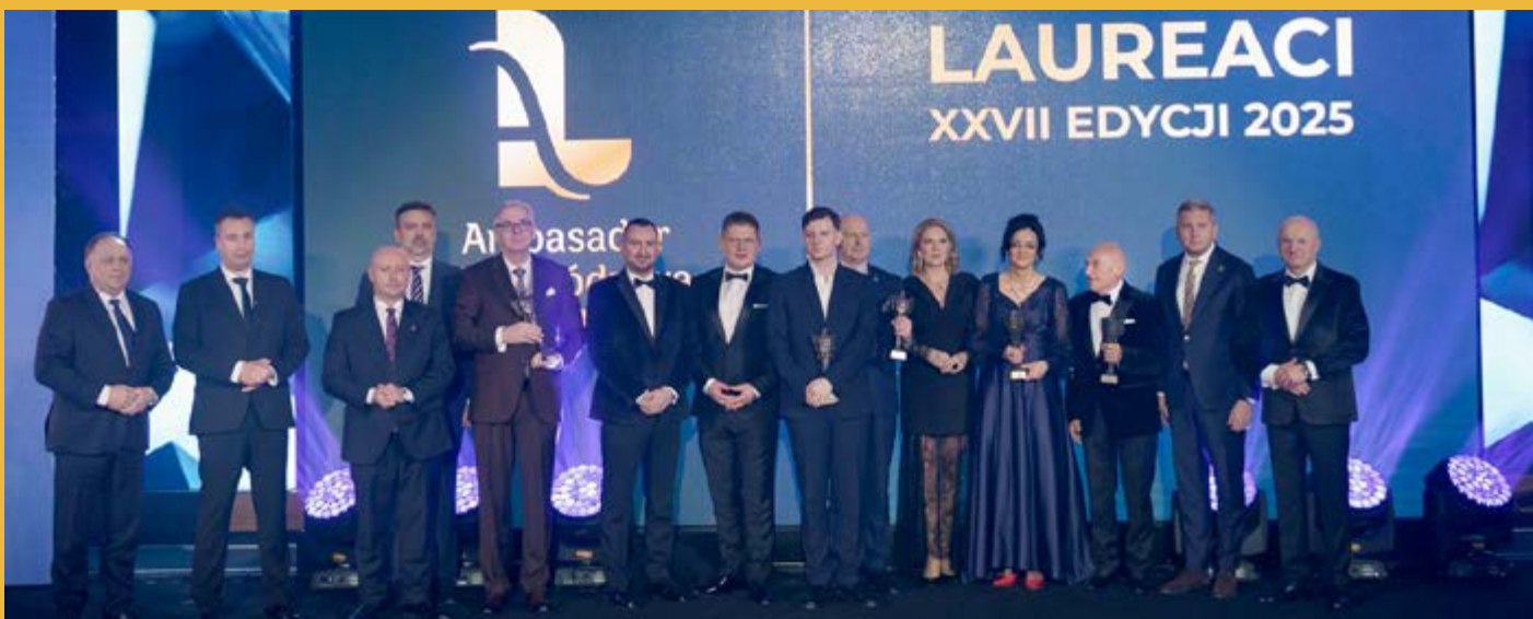
Laureaci wyróżnieni honorowymi tytułami „Ambasador Województwa Lubelskiego”