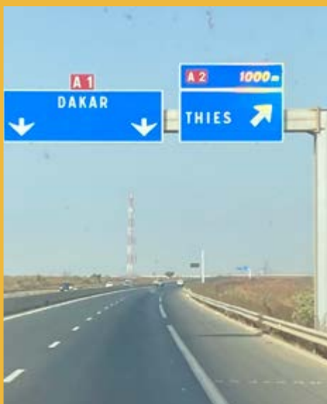
Jedziemy do Dakaru